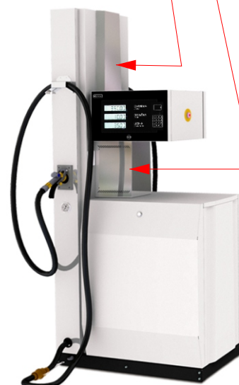
Топаз - 210Г