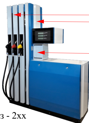
Топаз - 2хх

Внимание: опция "Декор из нержавеющей стали" для изделий серии 11х, 2хх, 3хх, 4хх будет доступна за отдельную плату