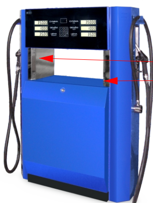
Топаз - 4хх