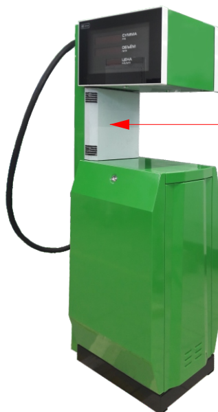
Топаз - 11х